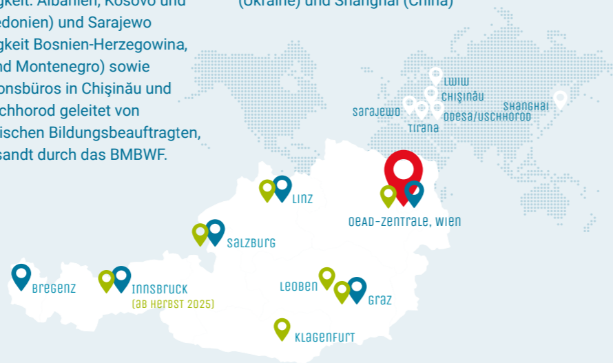
OeAD-Standorte Wohnhäuser für internationale Studierende

OeAD-Kooperationsbüros in Lwiw (Ukraine) und Shanghai (China)