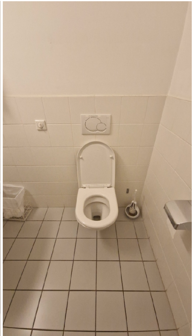
Abbildung 10: Ansicht der Toilette im Hochparterre