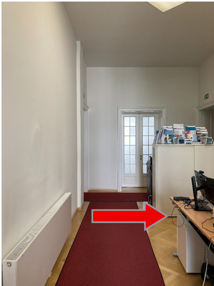
Abbildung 6: Empfangspult rechts im Gang

Nachdem Sie die Eingangstüre durchschritten haben, gehen sie rechts zwei Meter zum Empfangspult. Es gibt kein taktilen Leitsystem, auf dem Boden liegt ein roter Teppich.