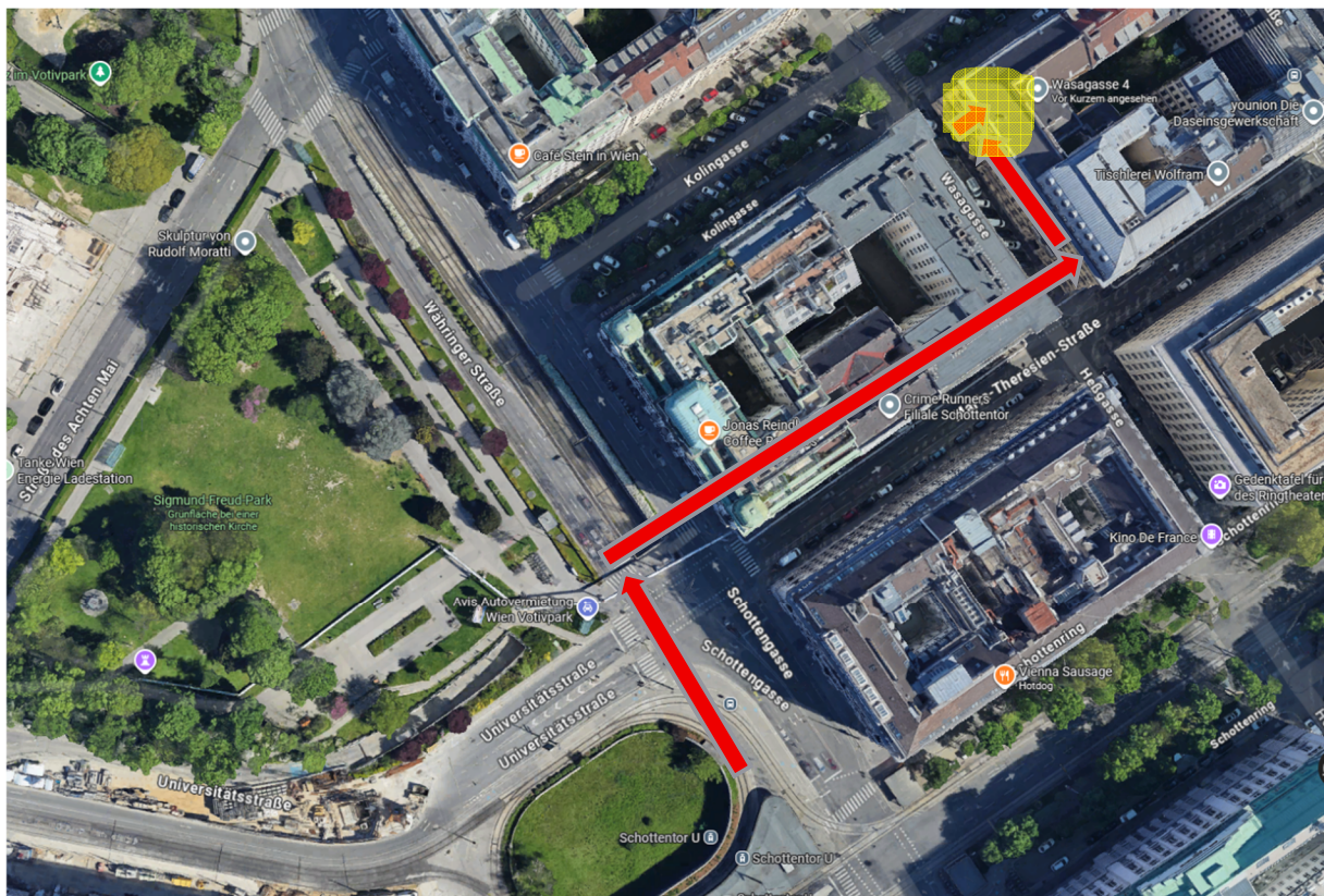
Abbildung 1: Fußweg von der U2 Station Schottentor zum OeAD-Gebäude in der Wasagasse 4

Gehen Sie über die Universitätsstraße (Ampel mit Signal). Biegen Sie rechts über die Währinger Straße (Ampel mit Signal) ab zur Maria-Theresien-Straße. Gehen Sie die Maria-Theresien-Straße entlang bis zur nächsten Kreuzung Wasagasse. Gehen Sie über die Wasagasse (Zebrastreifen). Gehen Sie links die Wasagasse entlang bis zum Haus mit der Nummer 4.