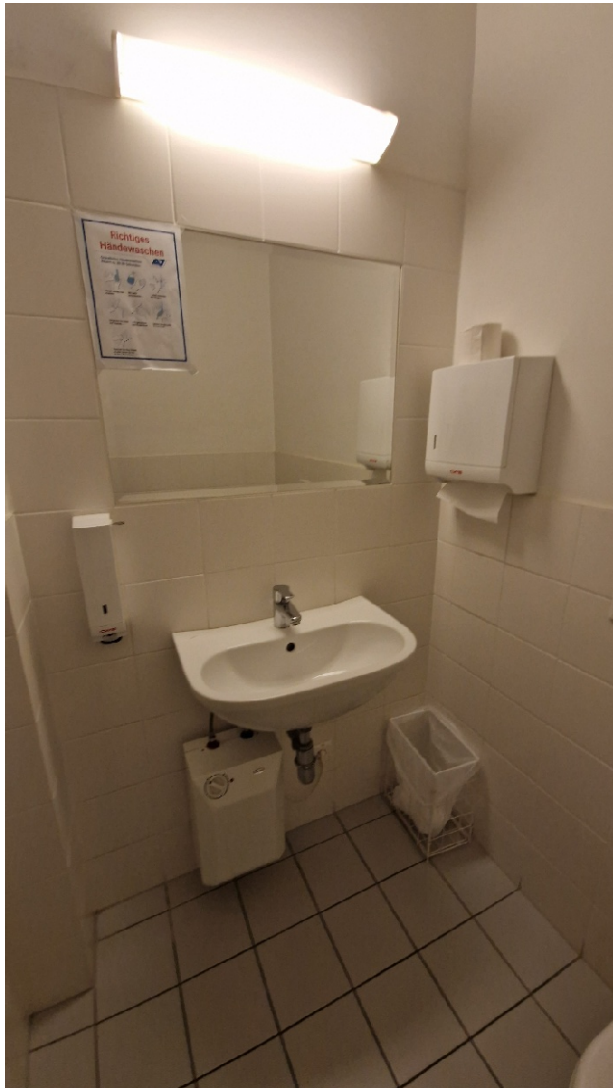
Abbildung 11: Ansicht des Waschbeckens einer Toilette im Hochparterre

Vor den Toiletten befindet sich jeweils ein Waschbecken. Der Gang zu den Waschbecken hat eine Durchgangsbreite von 157 cm.