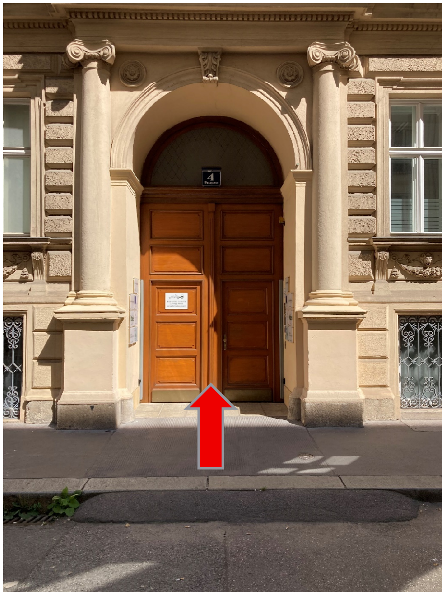
Abbildung 2: Eingang in das OeAD-Gebäude in der Wasagasse 4