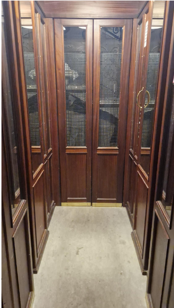
Abbildung 5: Innenansicht der Aufzugskabine im Erdgeschoß