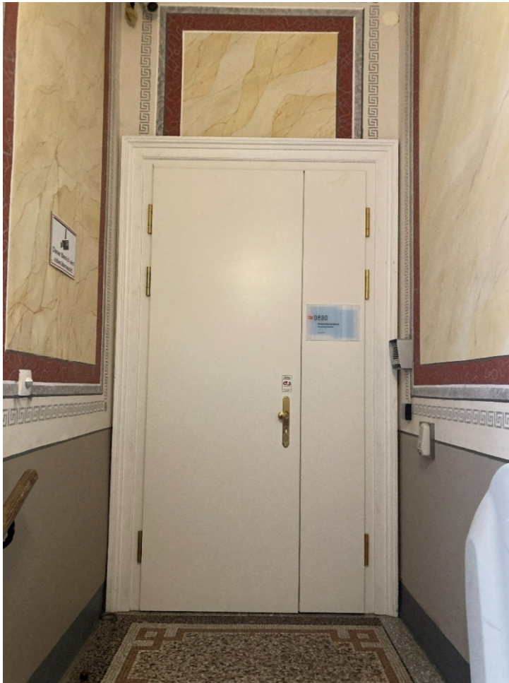
Abbildung 7: Eingangstür zum Besprechungsraum im Hochparterre

Der Eingang zum Besprechungsraum ist eine Drehflügeltür aus Holz. Eine Türglocke befindet sich rechts neben der Tür.