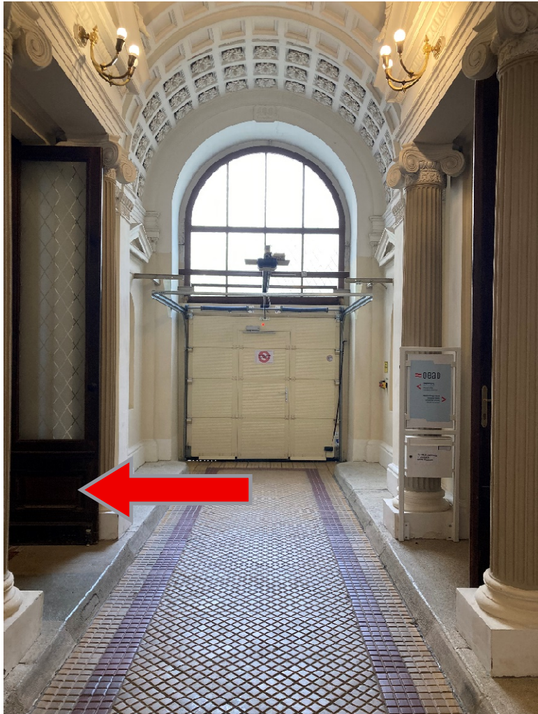
Abbildung 4: Eingangsbereich im Erdgeschoß der Wasagasse 4, die linke Türe führt zum Empfang im Mezzanin

Gehen Sie durch die Drehflügeltüre aus Holz und Glas auf der linken Seite. Die Türe ist manuell zu öffnen. Der Pfeil nach links kennzeichnet den Eingang. Nach dem Durchschreiten der Türe befinden Sie sich im Stiegenhaus. Hier finden Sie auch einen Aufzug, mit dem Sie in das Mezzanin gelangen. Er ist nicht barrierefrei.