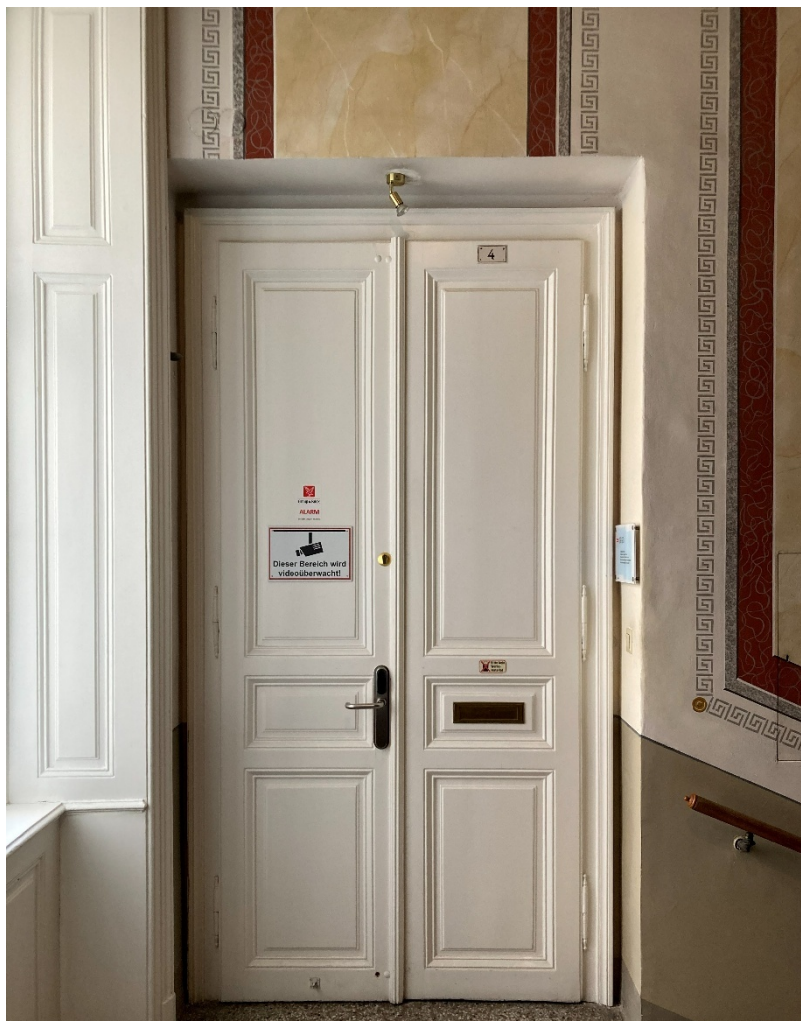
Abbildung 5: Drehflügeltüre im Mezzanin, durch welche man zum Empfang gelangt

Gehen Sie nach rechts. Sie erreichen den Empfang durch die OeAD Eingangstüre. Es ist eine Drehflügeltüre aus Holz. Die Türglocke befindet sich rechts der Türe in einer Höhe von 130 cm.