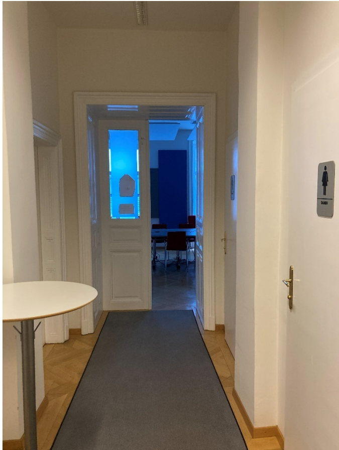
Abbildung 9: Gang mit anschließender Drehflügeltüre zum Besprechungsraum im Hochparterre

Nach dem Eingang rechts beginnt der Gang zu dem Besprechungsraum. Gehen Sie geradeaus durch den Gang. Nach etwa 8,2 m befindet sich hinter einer Drehflügeltüre aus Holz und Glas der Besprechungsraum. Die Drehflügeltüre lässt sich nach innen öffnen. Es sind keine taktilen Bodeninformationen oder Aufmerksamkeitsfelder vorhanden. Auf dem Boden liegt ein grauer Teppich.