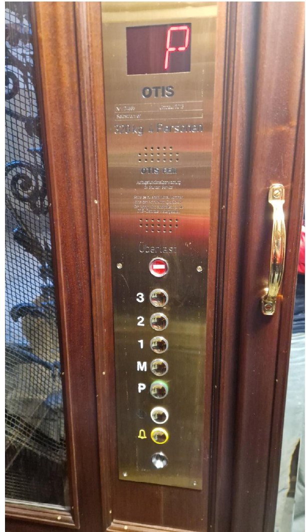
Abbildung 6: Bedienfeld im Inneren des Aufzuges