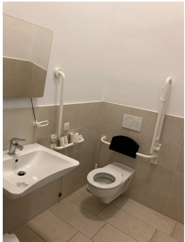
Abbildung 10: Innenansicht der Damentoilette im Mezzanin

Durchgangsbreite der Türe in geöffnetem Zustand: 80 cm