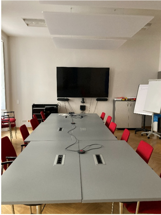
Abbildung 16: Innenansicht des Besprechungsraums im Hochparterre