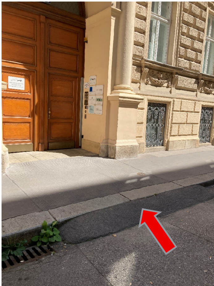
Abbildung 3: OeAD-Eingang Wasagasse 4 in Wien

Der Weg von den umliegenden öffentlichen Parkplätzen zum Eingang des OeAD-Gebäudes ist eben mit einem betonierten Gehsteig.