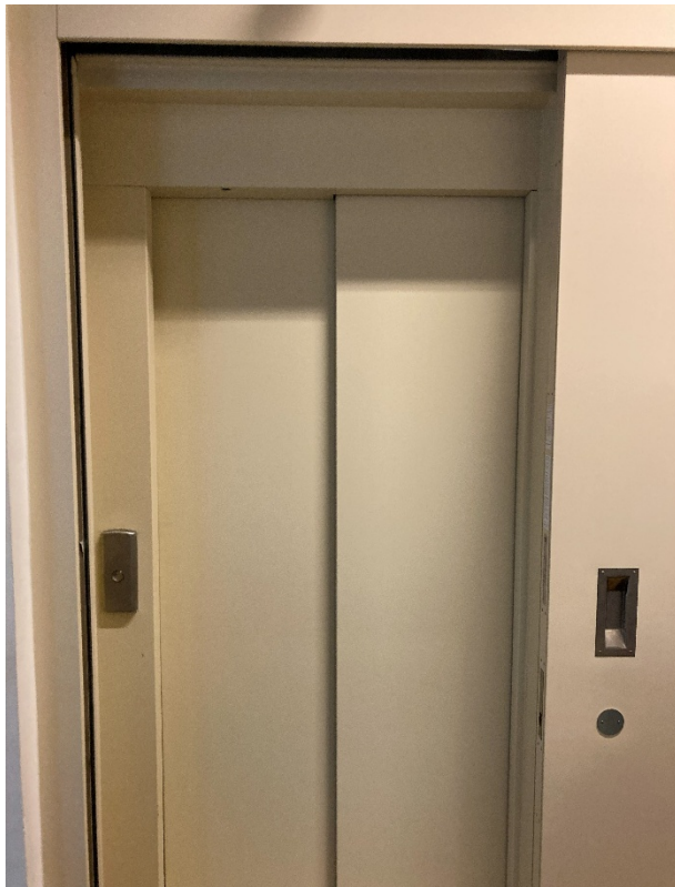
Abbildung 11: Türe des Aufzuges im Mezzanin

Höhe Druckknopf für Mezzanin „M“: 102 cm Höhe Druckknopf für Hochparterre „P“: 98 cm Breite: 107 cm Tiefe: 138 cm