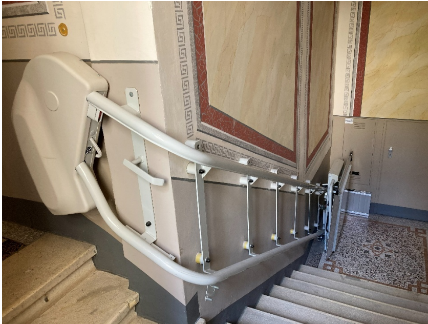
Abbildung 8: Barrierefreier Treppenlift, welcher den Eingangsbereich im Erdgeschoß mit dem Zugang zum Besprechungsraum im Hochparterre verbindet

Am oberen Ende des Treppenliftes befindet sich das Schlüsselloch für den Euro-Key rechts neben der Drehflügeltüre. Haben Sie keinen zur Verfügung, können diesen vorab beim Empfang anfragen. Um Unterstützung zu erhalten, informieren Sie bitte vorab Ihre Kontaktperson im OeAD und/oder rufen Sie +43 1 53408-0 an.