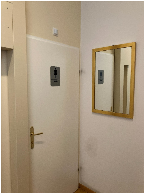
Abbildung 9: Türe zur Damentoilette im Mezzanin