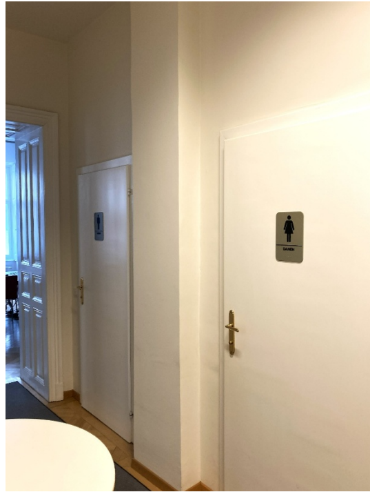
Abbildung 17: Die Türen zu der Damen- und Herrentoilette im Hochparterre