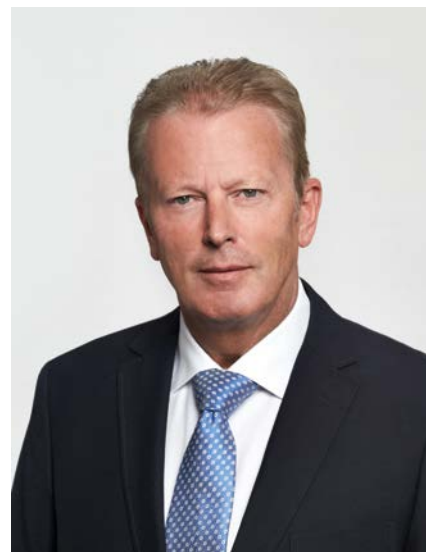
Vizekanzler Dr. Reinhold Mitterlehner Bundesminister für Wissenschaft, Forschung und Wirtschaft

In diesem Sinne bedanke ich mich bei allen, die sich in den Strategie-Entwicklungsprozess eingebracht haben und bin überzeugt, dass sie die „Nationale Strategie zur sozialen Dimension in der Hochschulbildung“ mit großem Engagement umsetzen werden.