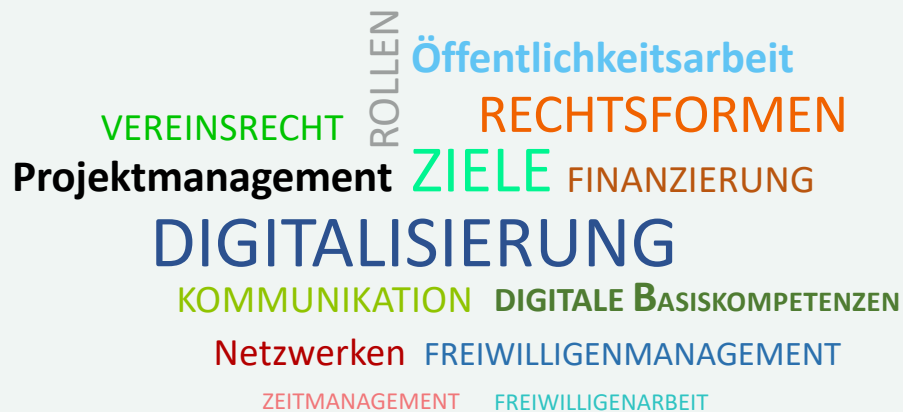
Bereiche der ProVol Bildungsangebote

Der Übergang zu digitalen Technologien hat nicht nur die Arbeitsweise von Freiwilligenorganisationen grundlegend verändert, sondern auch die Art und Weise, wie Menschen sich an diesen Organisationen beteiligen. Dadurch eröffnen sich neue Wege für die Partizipation von Menschen, die sich in der Freiwilligenarbeit engagieren möchten.