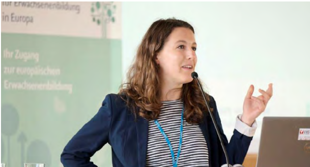
Key Note Beitrag

Beteiligungsformen ausgeglichen, da ehrenamtliches und politisches Engagement positiv mit Bildung und Einkommen korreliert. In einer „exklusiven Demokratie“ lässt sich ein struktureller Ausschluss bestimmter Bevölkerungsgruppen von Beteiligungsprozessen beobachten.