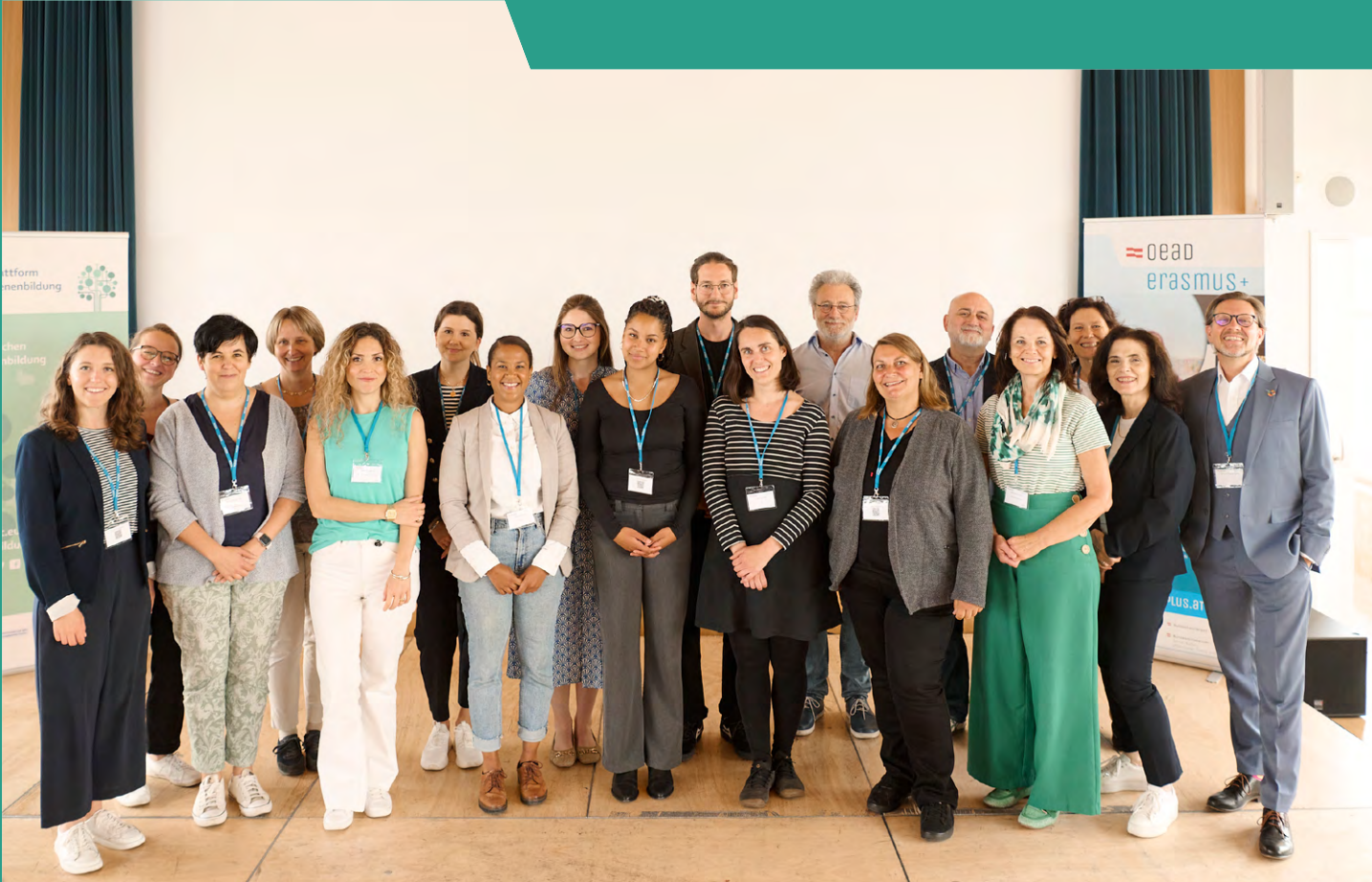
Speaker/innen und Organisationsteam der Konferenz