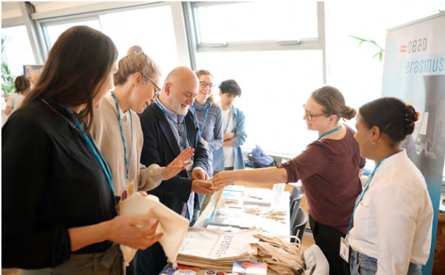
Information zu Erasmus+ Erwachsenenbildung