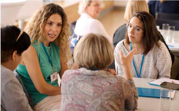
Diskussion auf der EPALE-Konferenz

gewählten institutionellen Kooperation verordnet und hatte verheerende Auswirkungen auf die griechische Bevölkerung. Ein weiteres Beispiel für die Machtverschiebung von Legislative zu Exekutive lässt sich in Frankreich finden. Dort verhängte die politische Exekutive nach dem islamistischen Terroranschlag von 2015 einen Ausnahmezustand, der vom damaligen Staatspräsidenten François Hollande in den zwei Folgejahren mehrmals verlängert wurde. Die zentralen Regelungen dieses Ausnahmezustandes überführte der nachfolgende Präsident Emmanuel Macron in Form eines verschärften Sicherheitsgesetzes in nationales Recht. Auch die „illiberale Demokratie“, also eine autoritäre Spielart der repräsentativen Demokratie, ist wesentlicher Bestandteil einer Autoritären Wende. In Ländern wie Ungarn, der Türkei oder Russland existieren die institutionellen Anforderungen einer Demokratie, doch die Bevölkerung ist in der Ausübung von Grundrechten teils massiv eingeschränkt. Es lassen sich ein Mangel an Freiheitsrechten (z. B. Einschränkung der Opposition), staatliche Kontrollen von Medien sowie Verbote von NGOs beobachten. Staaten mit autoritären Elementen zielen auf inaktive Bürger/innen und verhindern so ihre Partizipation.