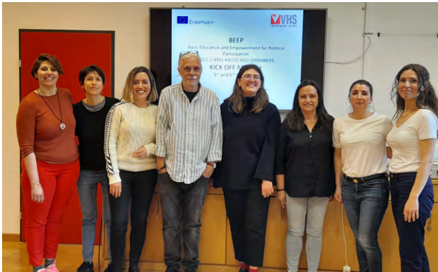
BEEP Kickoff Meeting

Aus Perspektive einer Unterrichtenden muss Beteiligung zu echten Ergebnissen führen: „Wenn die Beteiligung an Bedingungen geknüpft ist, ist sie keine echte Beteiligung.“ (Lehrkraft aus Portugal)