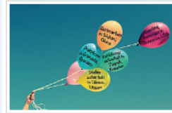
Die Infomesse Auslandsstudien und Auslandsstipendien findet am 14. Oktober statt.

Am 14. Oktober findet an der Karl-Franzens-Universität Graz die Informationsmesse „Auslandsstudien und Auslandsstipendien“ statt. Studierende, AbsolventInnen und Jung-ForscherInnen haben die Gelegenheit Informationen zu diversen Mobilitätsprogrammen, -stipendien und -praktika zu erfahren. Veranstaltet wird sie vom Büro für Internationale Beziehungen an der Uni Graz in Kooperation mit vielen PartnerInnen: