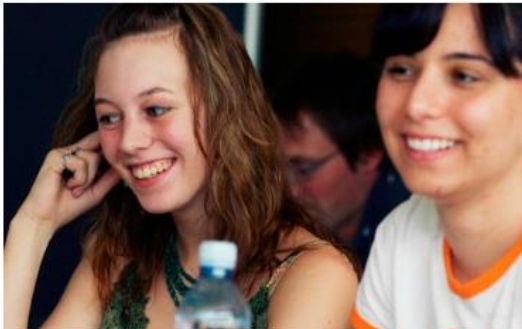
Vorarlberg University of Applied Sciences offers various courses in ENGLISH language.