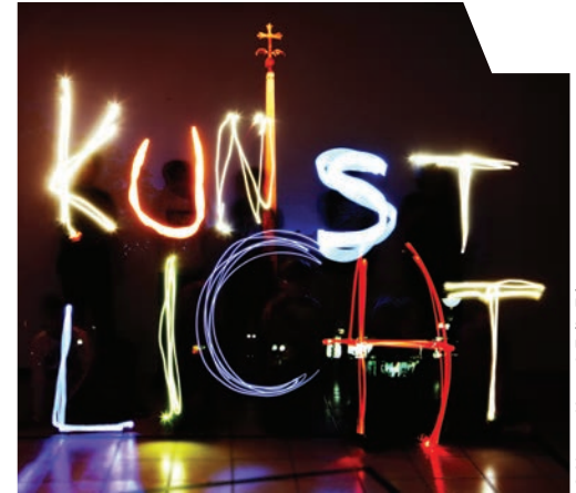
© Hanno Kautz & Felix Eder